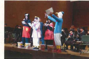
<担任の先生方の友情出演>

10月22日(土) たんば田園交響ホールにて、篠山中学校吹奏楽部第32回定期演奏会が行われました。今まで、支えて下さった方々に「感謝」の気持ちを込めて演奏しました。