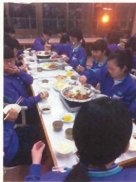
＜第1日目＞ 快晴の中、実習ができました。夕食は、焼肉

＜第2日目＞ 曇りのち小雨 各班、林間コースへ 昼食はカレー、夕食は鍋でした。 みんな完食！