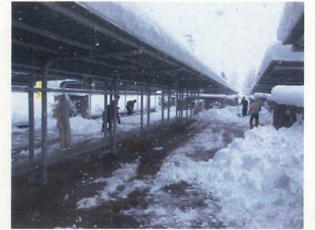
＜駐輪場の除雪作業＞

20数年ぶりの大雪となりました。気象警報が発令されたわけではありませんが、降雪量が30～50cmとなり、通学路の安全確保ができないため、市内5中学校すべてが臨時休校となりました。