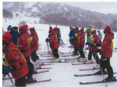
リフト乗り場も、人が多くなりました。