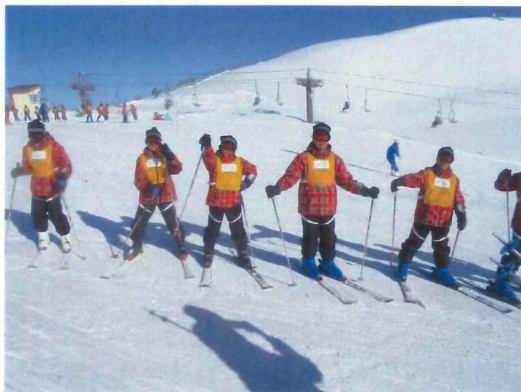
＜第3日目＞ 最終日となりましたが、またまた快晴。みんな3日間で相当うまくなりました。