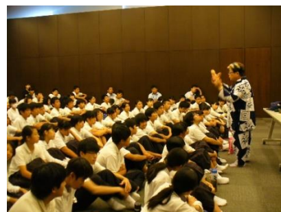
【3年生：性教育講演会】

あいさつに「ありがとう」の言葉を加えてもらいたいと思います。ありがとうは人と人との心をつなぐ鍵です。家族の一員として感謝の気持ちをもって生活してください。