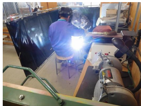
【キャンドルスタンド製作 溶接】

具体的な活動では、シルバーリング（銀の指輪）、フード付きベスト、海老のニューバーグ（調理実習）、バケツ型小物入れ、錫の鋳造オブジェ、キャンドルスタンド、テープカッター（木工）、パスケース（革細工）について、班に分かれ、兵庫の匠（ものづくりの専門家）に教えていただきました。本物に近いリアルな体験をすることができました。