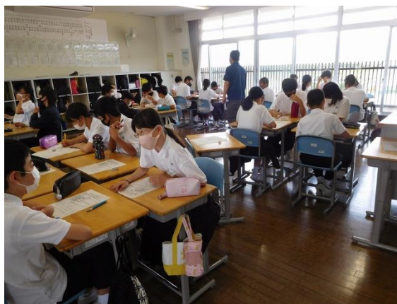
【1年生 学級活動 仲間づくりのグループワーク】

さて、新型コロナウイルス感染防止に伴う様々な制限がありましたが、生徒たちは学習に運動に集中してがんばっています。来校者の方に参観いただき、生徒がニコニコしながら受けている授業が多いことを評価していただいています。今年度、職員の行動目標に「素早く、丁寧に、そして笑顔で」をあげています。7月には保護者懇談(3年生は三者懇談)もありますが、生徒の悩みに早期に気づき、生徒が胸に落ちるよう丁寧に懇談していきたいと思えます。加えて、「笑える授業」を充実させていきたいと思えます。「笑いのあるクラス」は「学力のあるクラス」につながっていきます。それは、①指導すべき内容を焦点化しているので生徒にゆとりがある、②教師が子どもと一緒に楽しみながら追究している、③しっかりほめる。などの要素がある授業だからです。1学期の授業を笑顔で締めくくっていきます。