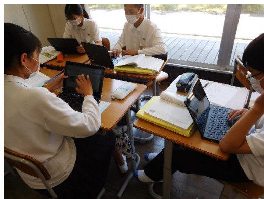
●ICTを活用したグループ学習

睡眠時間は確保されている傾向があります。ただし、ゲーム、メール・SNSの使用時間が2・3年生で長いために、平日、休日ともに学習時間が短くなる傾向が見られます。このことは、学習内容