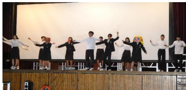
(生徒会オープニング)

なお、合唱コンクールで2年生と3年生の最優秀賞と優秀賞をとったクラスは市または丹有の音楽会でも美しい歌声を披露してくれました。